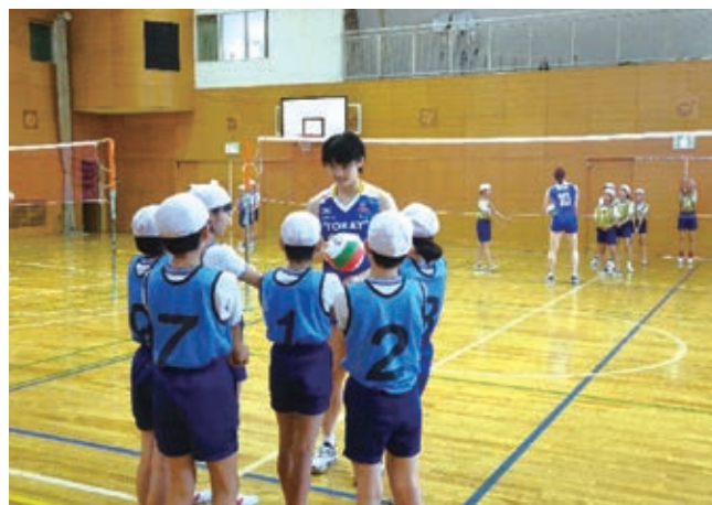
小学校「体育」に新たに導入されたソフトバレーボールの授業支援を地域で展開

また、社会的課題には、一企業、一業界、一地域だけでは解決できない問題も数多く存在する。そのため、課題に関心を持つ幅広いステークホルダーと協働し、社会貢献活動を推進することが求められる。このようなステークホルダーとの連携を通じた社会貢献活動は、経済的価値と社会的価値を両立する「共有価値創造」につながるという考え方は、事業活動にも広がってきている。