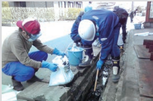
東日本大震災の被災地支援として企業人ボランティアプログラムを実施