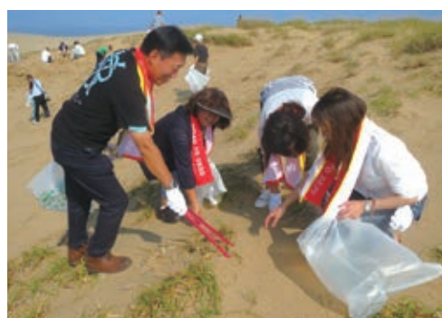
鳥取での海岸清掃ボランティア

従業員の価値観が多様化し、仕事以外の面でも社会の役に立ちたい、あるいは社会との関係をもっといたいという人が増えている。こうした従業員を多数擁することは、会社の社会的感度を高めていくことにもつながる。また、会社が従業員の社会参加を支援することは、従業員の会社に対する誇りを高め、仕事に対する姿勢や目的意識にもプラスの影響を与える。企業の社会的責任への取り組みの実践者としての従業員の意識を高めることもできる。