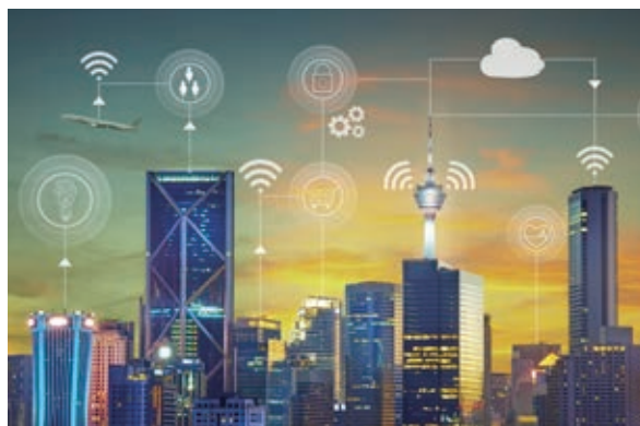
IoT化が進む社会