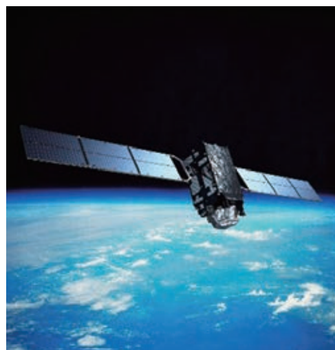
交通、防災などの社会的課題を飛躍的な解決に導く準天頂衛星「みちびき」

さらに、知的財産の適切な保護と活用は、企業活動の基盤であるとともに、企業の競争力の源泉である。個々の企業レベルにおいても、適正な行動が求められる。