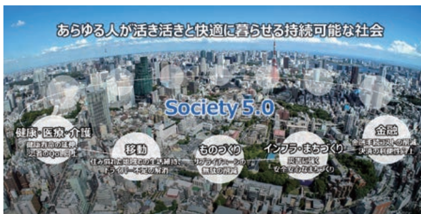
Society 5.0

「Society 5.0」(超スマート社会)の実現に向けては、IoT、ビッグデータ、AI、ロボットなど革新技术を最大限に活用し社会全体の最適化を図る必要がある。そのため企業には、自社・グループ企業のみならず、競合他社や他業界、研究機関や地域社会など多様なステークホルダーと連携し、オープンイノベーションを推進することが求められている。