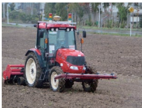
ICT技術を活用して農作業を効率化 (北海道岩見沢市)