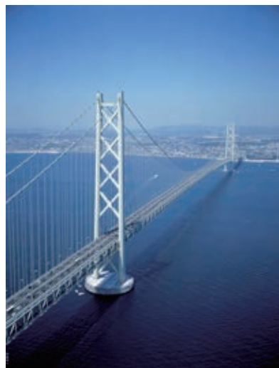
地域の交通や防災ルート、観光に貢献する「明石海峡大橋」

⑦ 国外においては、行政と連携し、貿易投資上の障害（資材・機材に対する高関税、過度なローカルコンテンツ要求、送金規制など）の緩和を図る。