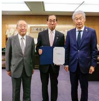
松本大臣(中央)への建議 (2023年12月26日)