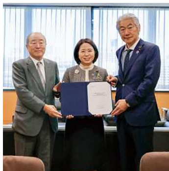
自見大臣(中央)への建議 (2023年12月26日)

協創アクションプログラム)を含めて、地域間連携をはじめ各地における地域協創に向けた取り組みを展開・推進していく。