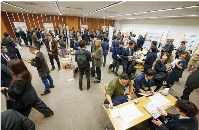
九州経済連合会との共催で開催した「九州マッチング会」

情勢の変化に加え、コロナ禍の影響、長期にわたる経済の停滞や昨今の物価高騰などにより、国民生活の質や水準に影響を与える様々な課題が顕在化している。こうした課題を解決するためには、行政の対応だけではなく、民間によるイノベティブな活動が求められている。JANPIAでは、休眠預金活用事業を通して団体と連携し、課題解決を進めているが、社会の構造を革新するようなイノベティブな取り組みに