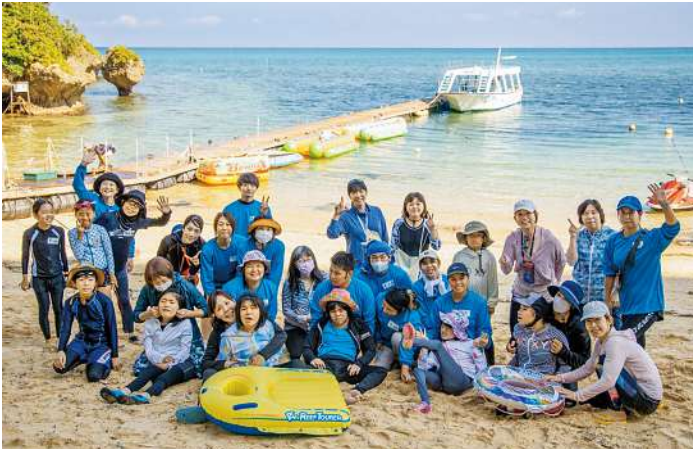
医療的ケア児の初めての海体験を支援

情勢の変化に加え、コロナ禍の影響、長期にわたる経済の停滞や昨今の物価高騰などにより、国民生活の質や水準に影響を与える様々な課題が顕在化している。こうした課題を解決するためには、行政の対応だけではなく、民間によるイノベティブな活動が求められている。JANPIAでは、休眠預金活用事業を通して団体と連携し、課題解決を進めているが、社会の構造を革新するようなイノベティブな取り組みに