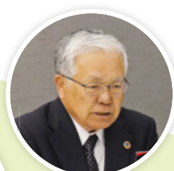
古賀審議会議員長