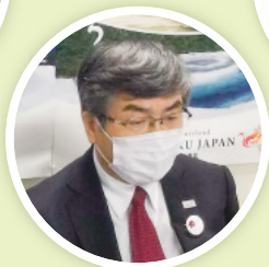
紺野東北観光推進機構 専務理事