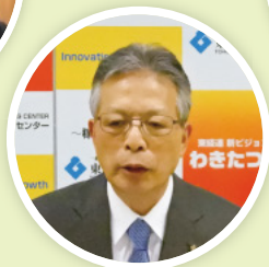
海輪東北経済連合会会長