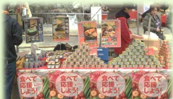
被災地産食品の販売フェア