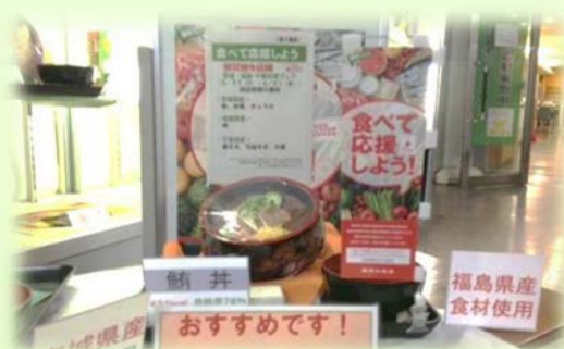
被災地産食品を使用したメニューの提供